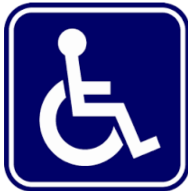
สัญลักษณ์ผู้พิการ